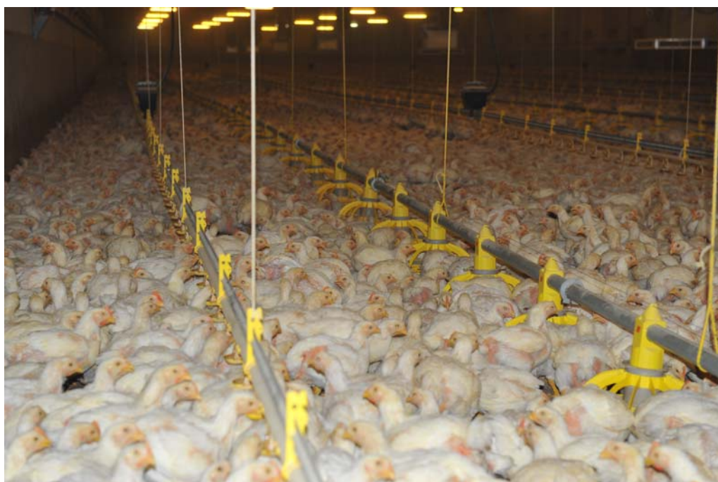
In riesigen, fensterlosen Hallen werden die Masthühner in nur 35 Tagen auf ihr Schlachtgewicht gemästet. Die Interessenvertretung der Bauernschaft ist nun bemüht, diese Besatzdichte um ein Drittel zu erhöhen!

Landwirtschaftsministeriums nicht eingehalten (mündliche Auskunft). Seit geraumer Zeit fordern die MastflügelproduzentInnen, dass die gesetzlich vorgeschriebenen maximalen Besatzdichten bei Hühnern um 30 Prozent und bei Puten sogar um 50 Prozent erhöht werden sollen. Bei einem derartigen Besatz wäre über 92 Prozent der Bodenfläche allein durch die Körper der Tiere angefüllt, es würde kein Platz mehr für irgendeine Bewegung frei bleiben.