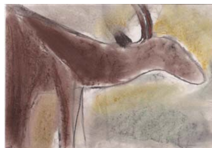
Höhlenmalerei: Eindrücke aus der Welt des Reisens in einer Höhle

Wenn es dir Freude bereitet, interessierten Naturreisenden deine Lebenswelt zu öffnen, ergreife als Bereister die Initiative und wende Dich mit deinem Angebot an uns. Du bist Teil deiner Landschaft und hütet das Wissen um sie. Lehre bewegten Menschen deine Wurzeln fühlen. Ich bereise meine Wurzeln und erzähle deine Geschichten. Ich erinnere mich deiner Weisheiten. Ich lese in deinen Spuren. Ich verstehe die Vögel und das Vieh. Ich schweige mit den Fischen. Ich weiß von deinen Pflanzen. Ich kenne deine Wildheit. Ich spiegle mich in deinen Wassern. Ich durchstreife deine Wälder. Ich bestelle deinen Garten. Ich koste von deiner Landschaft. Ich lebe deine Rhythmen. Ich atme deine Leidenschaft. Ich bewohne den Wind, so ist es mit dir mittelsame Natur.