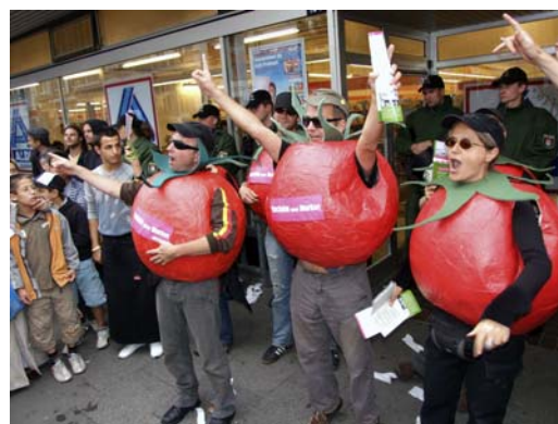
"Supermarktgemüse = Klimakiller. Luxus für alle - Bio für alle" stand auf einem Transparent bei einer symbolischen Supermarktbesetzung, die im Sommer 2008 in Hamburg stattfand. Ca. 400 Personen beteiligten sich an der Aktion, um gegen die ruinöse Preispolitik von Supermärkten und Discontnern sowie gegen Sozialdumping und Umweltzerstörung zu protestieren.