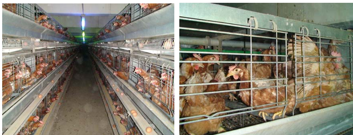
Ausgestaltete Legebatterien, wie sie in Österreich noch bis zum Jahr 2020 erlaubt sind.

Huhn in einer Bodenhaltung legt weniger Eier als in einer Legebatterie, und ein Huhn in Freilandhaltung noch weniger als in Bodenhaltung. Es hat sich also auch die Effizienz der Produktion, d.h. die Produktionsleistung pro Tier, verkleinert. Abgesehen davon passen doppelt so viele Hühner in eine gleich große Legebatteriehalle, wie in eine Bodenhaltungshalle. Die Besatzdichten pro Bodenfläche wurden durch das Legebatterieverbot halbiert. Dafür können die Tiere hochgestellte Sitzstangen, eingestreute Bodenflächen und eigene Nestboxen benutzen. Die Arbeitssituation der Tiere hat sich bedeutend verbessert. Ein Gutteil der Kosten der Mehrproduktion wurde auf die KonsumentInnen abgewälzt.