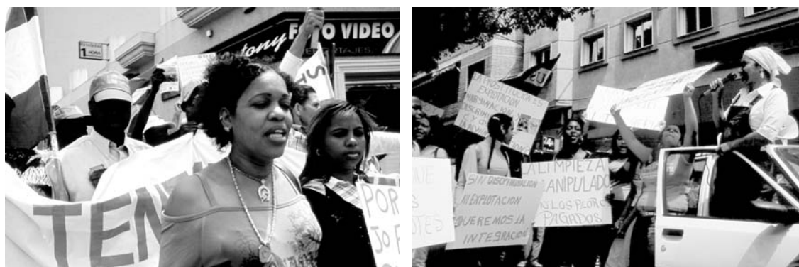
In der Provinz Almería organisieren sich migrantische ArbeiterInnen gegen Rassismus, Sexismus und Ausbeutung. Dem Aufruf der Gewerkschaft SOC zu einer 1. Mai- Demonstration in der Kleinstadt Roquetas del Mar, die von Plastikgewächshäusern umgeben ist, kamen mehrere hundert Personen. Für eine Provinzkleinstadt im Süden Andalusiens ein nie dagewesenes Ereignis.

Wir untersuchten die Genese des „Plastikmeers“. Ebenso begannen wir uns mit den Hintergründen der Migration nach Almería zu beschäftigen. Dabei stießen wir wieder auf das Thema Landwirtschaft – diesmal in den Herkunftsländern der MigrantInnen. Viele LandarbeiterInnen in Almería kommen aus vorwiegend agrarisch geprägten Gesellschaften. Somit war es nahe liegend, sich mit der gegenwärtigen Lage bäuerlicher Produktionsweisen in den Ländern des Maghreb, Westafrika oder Osteuropa zu beschäftigen.