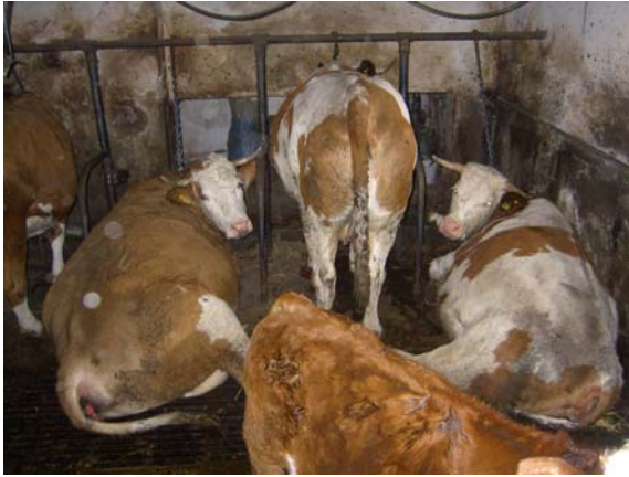
Die ganzjährige Anbindehaltung von Kühen ist gerade bei kleineren Betrieben noch gängige Praxis in Österreich. Das Gesetz würde einen Auslauf an mindestens 90 Tagen fordern.

Auch in der Rinderhaltung ist die Situation aus tierschützerischer Sicht katastrophal (VGT 2008). Mit In-Kraft-Treten des Bundestier-schutzgesetzes 2005 wurde das Ende der mittelalterlichen Anbindehaltung vor allem von Milchkühen gefeiert. Doch zu früh: in letzter Sekunde wurde von der Interessensvertretung der Tierindustrie eine Reihe von Ausnahmen in das Gesetz reklamiert, die sicherstellen, dass sich RinderhalterInnen nicht an das Anbindehaltungsverbot halten müssen. Einerseits ist der vorgeschriebene Weidegang von 90 Tagen im Jahr nur sehr schwer zu kontrollieren. Andererseits können die LandwirtInnen sich selbst ohne Behördengang eine Ausnahmegenehmigung für das Anbindehal-