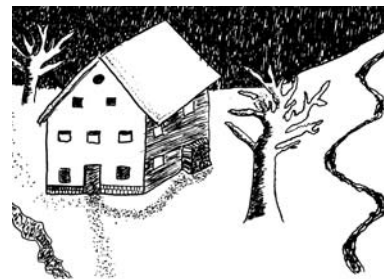
Eine einfache Federzeichnung des Anwesens Gebetsroither