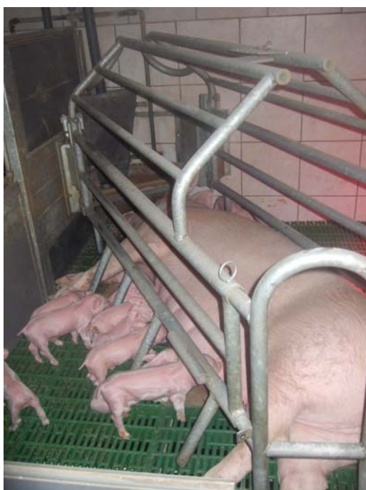
Abferkelbucht. - 72 Prozent aller Muttersauen sind während der gesamten Schwangerschaft in Kastenständen zur vollkommenen Unbeweglichkeit verdammt und nach der Geburt in solchen Abferkelbuchten.

Würde man einem Schwein Stroh geben, würde es deswegen nicht mehr oder rascher Fleisch produzieren. Umgekehrt kostet das Stroh aber nicht nur Geld, man muss auch noch jemanden bezahlen, der das vom Schwein verschmutzte Stroh wieder entfernt, um Ausfälle wegen Erkrankungen zu verhindern. Stattdessen ist ein Vollspaltenboden viel billiger. Die Tiere treten ihren Kot durch die Spalten und dieser lässt sich mühelos automatisch unterirdisch entsorgen. Die profitabelste Methode ist also die Schweine ohne Stroh auf Vollspaltenböden zu halten. Daher finden wir 86 Prozent aller Schweine Österreichs in dieser Haltungsform (siehe Verein Gegen Tierfabriken 2008). Dass dabei die Tiere, die unter natürlichen Umständen ihren Lebensbereich kotfrei halten insbesondere weil sie einen sehr ausgeprägten Geruchssinn haben, ununterbrochen in respektive über ihren Exkrementen leben müssen und fast flächendeckend Atemwegserkrankungen bekommen, ist das Problem der Schweine, nicht der SchweinemästerInnen. Solange sie nicht sterben oder der Fleischzuwachs zurückgeht, ist für die BetreiberInnen der Schweinefabriken alles in Ordnung.