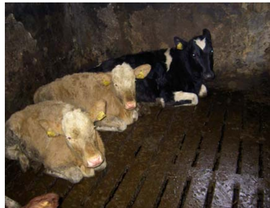
Auch Kälber dürfen ab dem 4. Lebensmonat auf Vollspaltenboden gehalten werden.