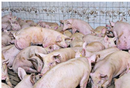
86% der Schweine in Österreich leben auf Vollspaltenböden.

Bei den Schweinen hat eine Reihe von Studien bestätigt, dass in Österreich katastrophale Haltungsbedingungen vorherrschen (VGT 2008). Hierzulande wird diesen Tieren gerade einmal das, was die EU als Minimum vorsieht, geboten: 0,7 m 2 Bodenfläche für ein 110 Kilogramm schweres Schwein, Vollspaltenboden ohne Strohstreue, Kastenstand und Abferkelgitter. Eine artgemäße Haltung muss hier, neben dem Zugang ins Freie, auf jeden Fall deutliche Verbesserungen bieten. In England ist die Freilandhaltung von Schweinen durchaus verbreitet. Dort werden die Tiere in Gruppen auf einem Acker gehalten, als Unterstand dient eine Wellblechhütte.