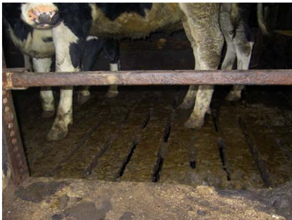
Mastrinder werden vorwiegend in Buchten mit Vollspaltenboden gemästet

Das Resultat ist, dass die Anbindehaltung weit verbreitet geblieben ist. Ebenso muss die Enthornung als äußerst problematisch gesehen werden, die in den ersten zwei Lebenswochen ohne Schmerzausschaltung zulässig ist, wenn sie mit einem Brenngerät vorgenommen wird. Dieser brutale Eingriff wird von RinderhalterInnen als notwendig erachtet, weil sonst die Gefahr bestünde, dass sie von ihren Tieren verletzt werden würden. Kühe werden allerdings nur aggressiv, wenn sie entweder zu wenig Platz haben oder von den HalterInnen schlecht behandelt werden. Selbst für Ziegen, für die die Enthornung bereits verboten war, wurde dieses Verbot mit demselben Argument wieder aufgehoben.